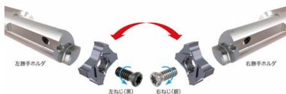
左右バイト インサート共通化