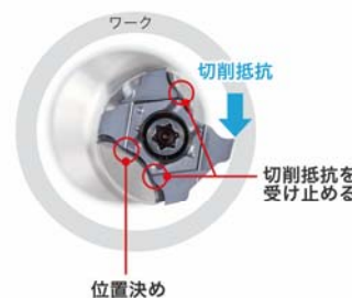
独自の3点クランプシステム