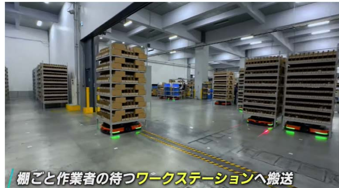
棚ごと作業者の待つワークステーションへ搬送