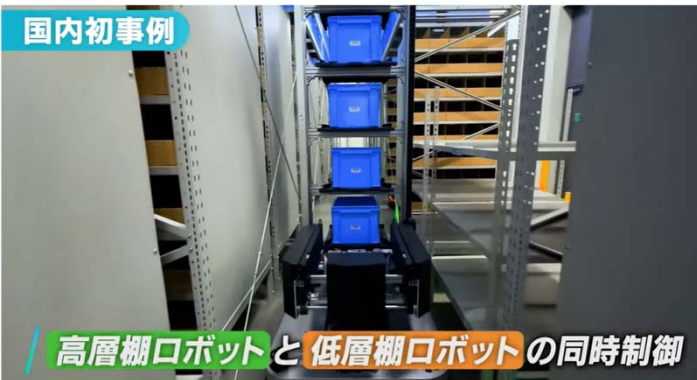
高層棚ロボットと低層棚ロボットの同時制御