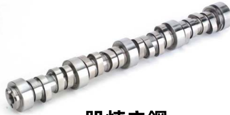
肌焼き鋼 ハード+ソフト