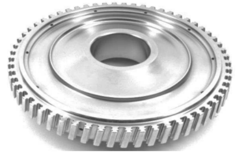
難削材の 仕上げ加工